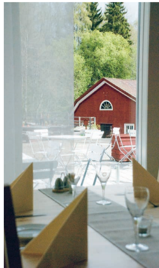
Den gamla tullkvarnen i Växbo är en av många kulturhistoriskt intressanta byggnader i Hälsingland. De mest kända är hälsingegårdarna, eller »träslotten«, som kanske blir utsedda till världsarv i sommar