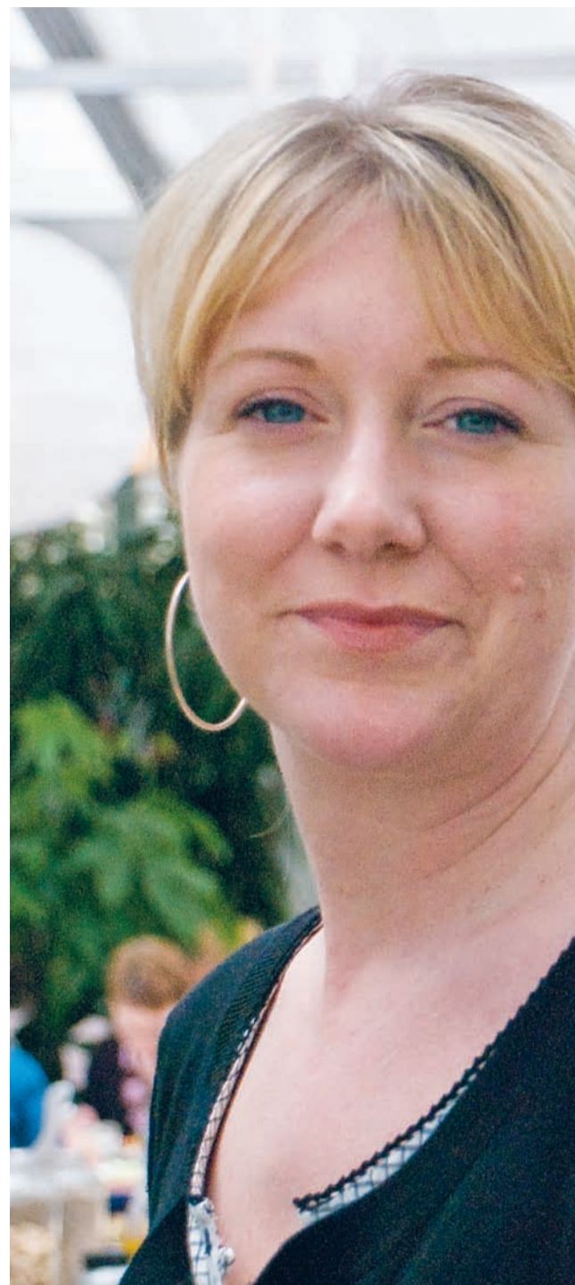
Bollnäs stora krog tillskott under 2008 är Lilla K:s Trädgårdskök som i

soner till det gästspelet. Orbaden säljer också weekendpaket med kockarna som dragplåster.