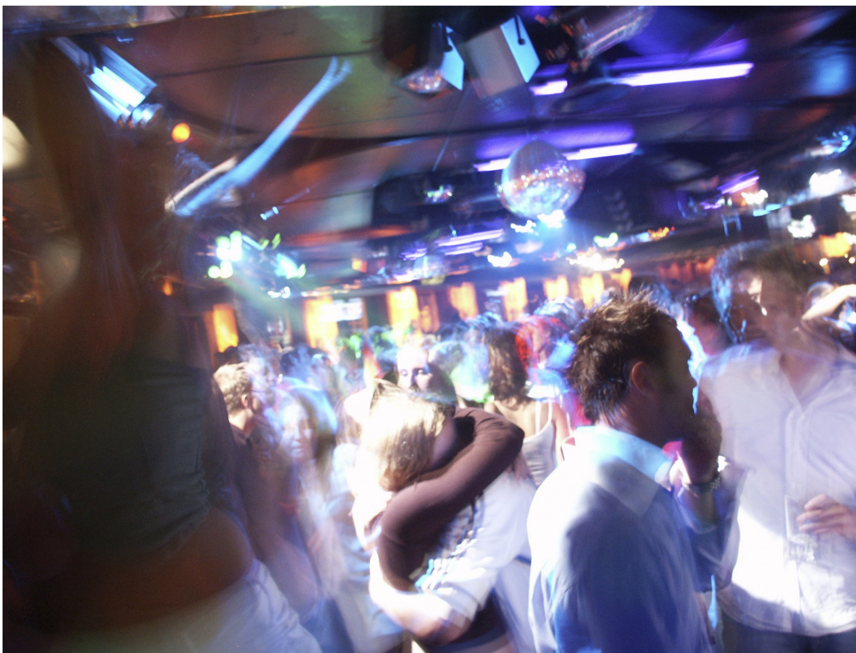
Sista dansen på Palace i Norrköping går den 13 juni. Nöjesrestaurangen har haft en mycket tuff period som nu slutat i konkurs. Fastighetsägaren ska göra om lokalerna till kontor.